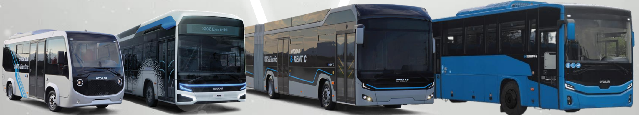
Otonom e-Centro 6m